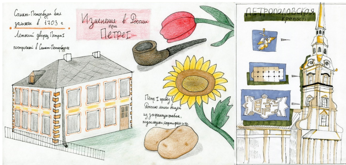
Рисунок 4. Ученические работы по теме «Архитектура Санкт-Петербурга»