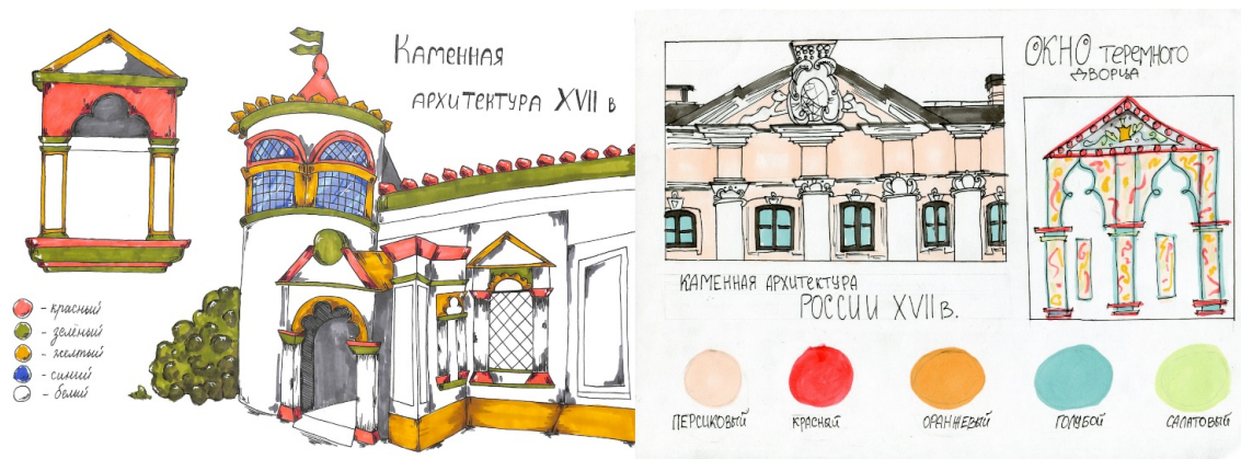
Рисунок 3. Ученические работы по теме «Русская каменная архитектура XVII века»