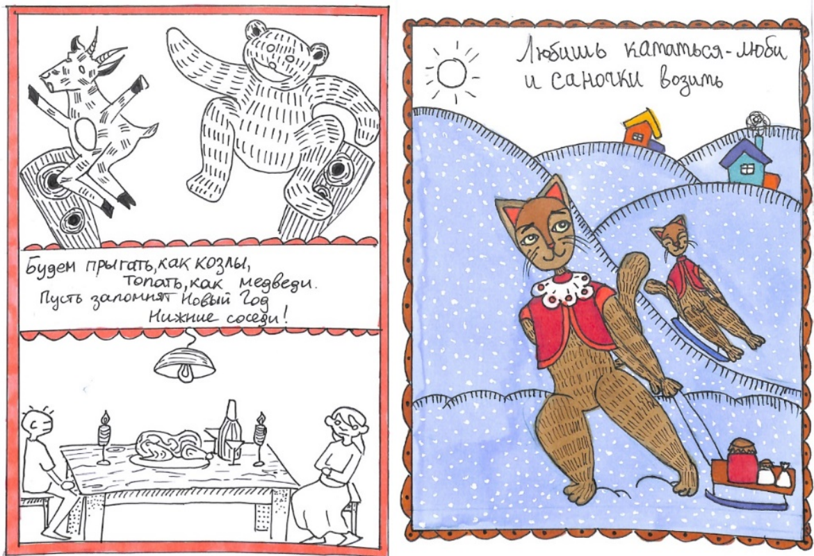
Рисунок 1. Ученические работы по теме «Возникновение русского народного художественного искусства»