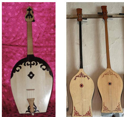
Рисунок 11. Современные домбры с анималистическим декором