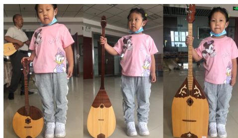
Рисунок 9. Скрипичная домбра (домра), жамбулдомбра, басовая домбра

округ Или (Синьцзян) 21.07.2022