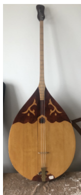
Рисунок 3. Бас-домбра

Культурный центр округа Или Синъюань. 15.07.2021