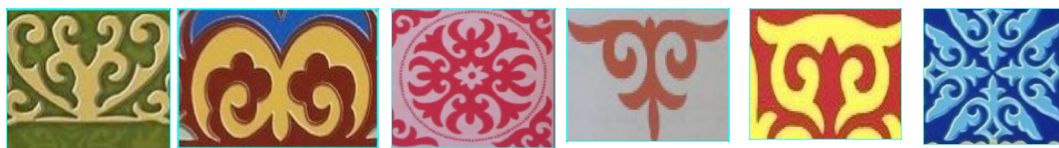
Рисунок 10. Рога животного, орел, сова, лебедь