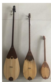
Рисунок 8. Детская домбра в центре

Фото 3, 4, 5, 6, 7. Городской культурный центр «Алтай» 09.2021; фото 5. Народный оркестр округа Или (Синьцзянь) 10.07.2021