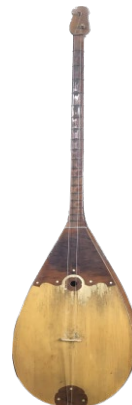
Рисунок 2. Жамбулдомбра

Культурный центр округа Или Синъюань. 15.07.2021