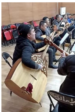
Рисунок 5. Контрабас-домбра