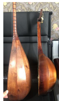
Рисунок 7. Жамбулдомбра и домра

Фото 3, 4, 5, 6, 7. Городской культурный центр «Алтай» 09.2021; фото 5. Народный оркестр округа Или (Синьцзянь) 10.07.2021