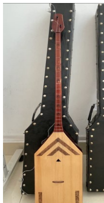
Рисунок 1. Абайдомбра