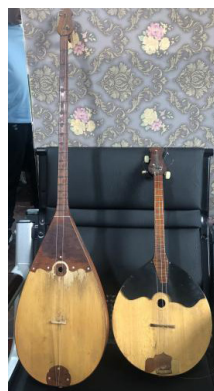
Рисунок 6. Жамбулдомбра и домра