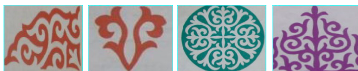
Рисунок 12. Растительный декор на домбрах