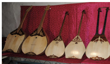
Рисунок 13. Современные домбры с растительным декором