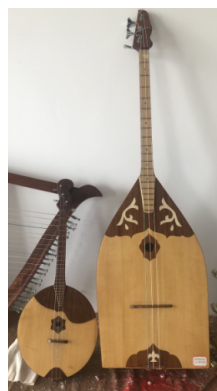
Рисунок 4. Бас-домбра